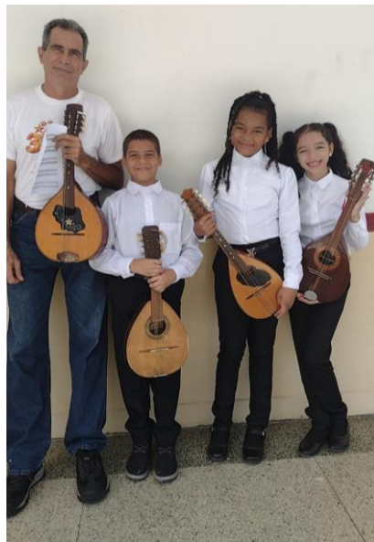
En la docencia