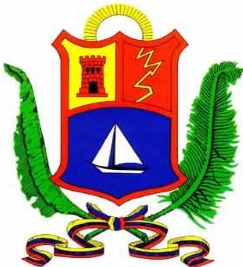
Escudo del Zulia-vigente

La Ley de Símbolos del Estado Zulia promulgada el 26 de octubre de 1995, en el Título III del Escudo de Armas del Estado Zulia, Capítulo I de las características y dimensiones del Escudo de Armas del Estado Zulia, Artículo 10º, dice en lo referente al cuartel de la izquierda: “El cuartel de la izquierda será rojo y contendrá un zigzag de color oro, compuesto de diez rasgos de diferentes dimensiones, simbolizando el Relámpago del Catatumbo”.