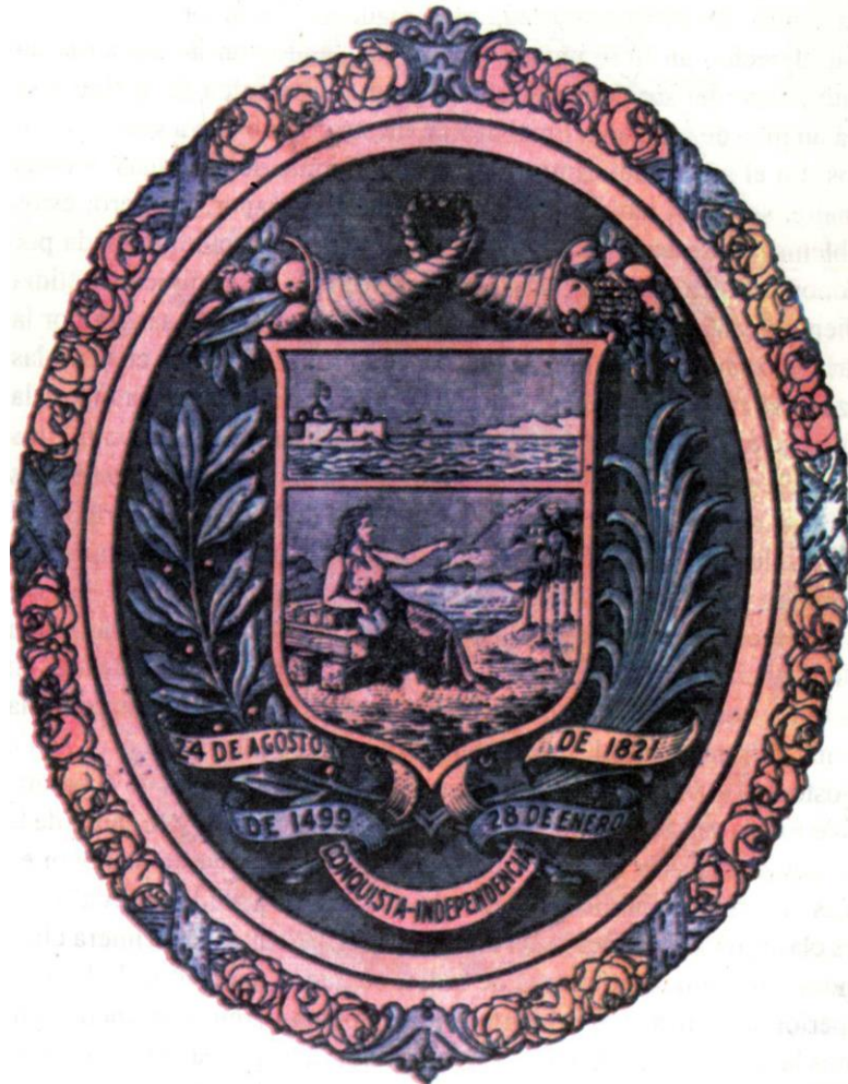
Escudo del Zulia 1905

Los colores que señala la ley no coinciden con los de esta representación gráfica.