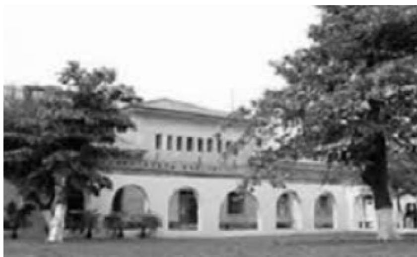
Sede de LUZ 1952