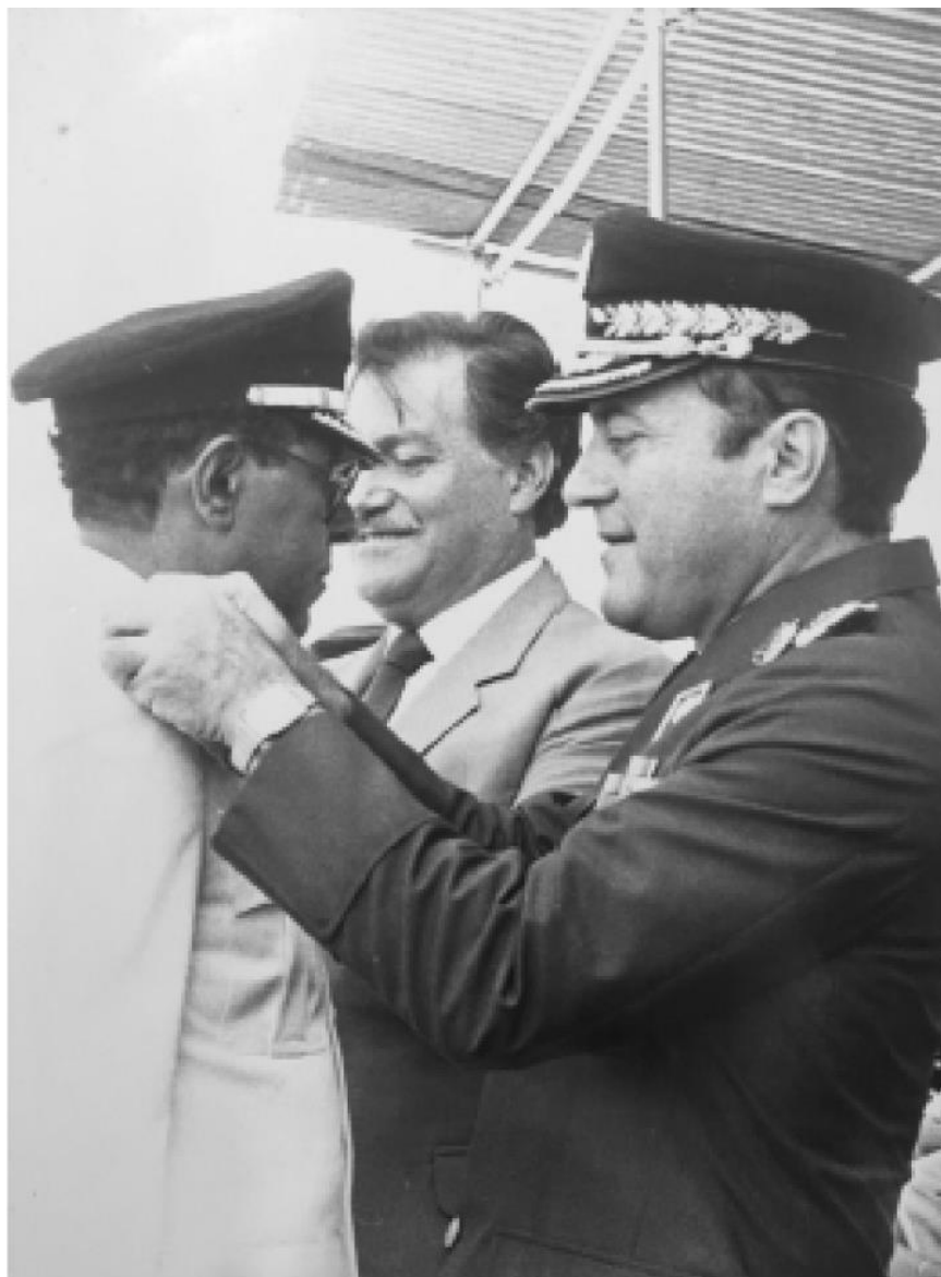
Ascenso a Teniente Coronel

(médicos, enfermeras, odontólogos-, La Cruz de Taratara, Mene Mauroa, Pedregal, Dabajuro, y Pueblo Nuevo, etc.). Eso fue tomando notoriedad y hubo mucha propaganda, la prensa hizo noticias de la labor que hacia el ejercito con estas actividades.