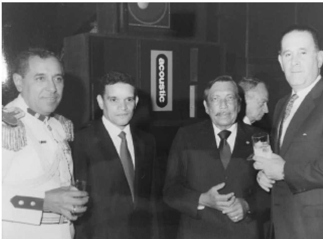
Con el grado de Coronel

describirlas. Que más tarde se extendieron al Zulia, donde muchas veces se apoyaron en las instalaciones hospitalarias que tenían esos lugares, entre éstos, Puertos de Alta Gracia, Villa del Rosario, Machiques, Casigua, El Cubo, Santa Bárbara... Y más tarde, Posteriormente, estas actividades quirúrgicas se hicieron populares y prácticamente eran solicitadas por mucha gente que nos pedían que fuéramos a realizar estas actividades quirúrgicas y lo hicimos; en varias oportunidades en mi pueblo, Caja Seca. Es bueno aclarar, que esas zonas distintas de Maracaibo había una infraestructura de salud pública muy buena, hospitales con todos los servicios, cuidados intensivos, laboratorios, rayos X, completos, pero, no se hacían intervenciones quirúrgicas porque no había especialistas. Entonces, nosotros con el ejército y el personal conformado en sitio, con apoyos de los Concejos Municipales para gastos de hospedajes en algunas partes porque en otras nos hospedábamos en las casas de la gente del pueblo.